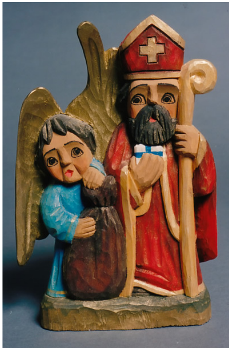
Saint Nicolas et l'ange (Pologne)