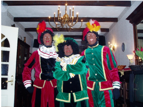
Zwarte Pieten