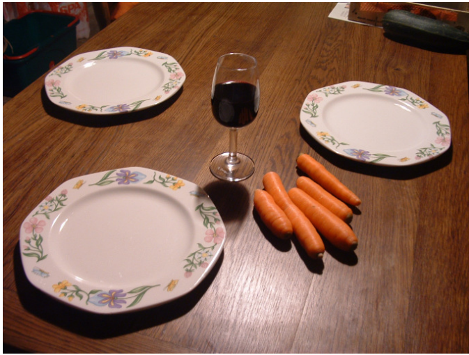
Illustrations 11 – 12 – 13 – 14 Saint Nicolas – Ecole des Magnolias Bruxelles