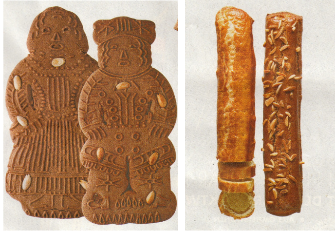
Illustration 40 – Gâteau de saint Nicolas