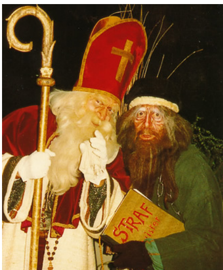
Saint Nicolas – Knecht Ruprecht