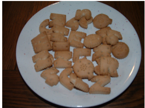
Illustrations 33 – 34 – Figurine de saint Nicolas, massepain