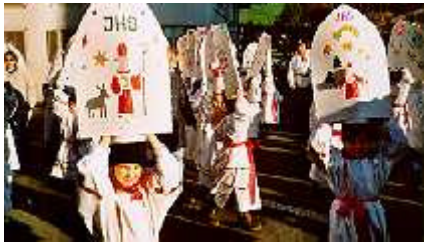
Illustrations 46 – 47 Sankt Niklaus en Suisse, statue chez Mme Birner