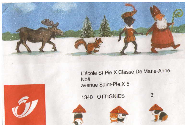
Illustration 24 – Livre reçu de la poste