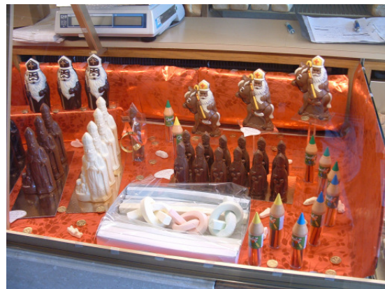
Illustration 28 – Assiette typique de saint Nicolas