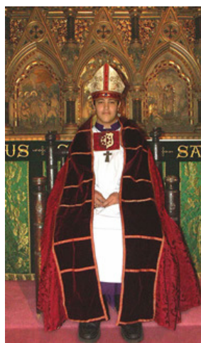
Illustration 43 – Enfant-évêque, Angleterre (Hereford)