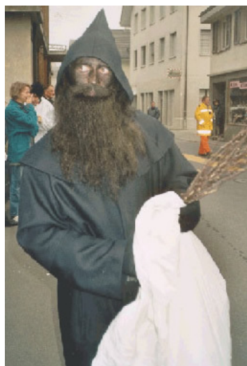
Illustration 44 – Suisse : Schmutzli (le sale)